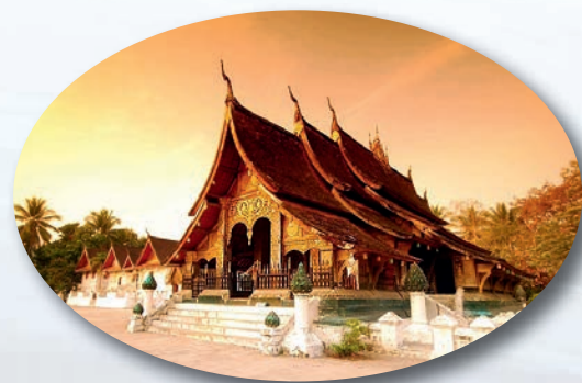
วัดเชียงทอง เมืองหลวงพระบาง

มหานทีแห่งแม่น้ำโขง แอ่งกร่าแห่งเอเชียอยู่ห่างจากเมืองปากเซไปประมาณ 150 กม.