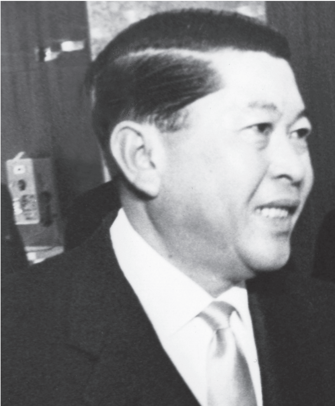
เรื่องโดย อภิภพ พิงชาญชัยกุล อัลบั้มขนิก 31698 รองเลขาธิการสภาอุตสาหกรรมแห่งประเทศไทย