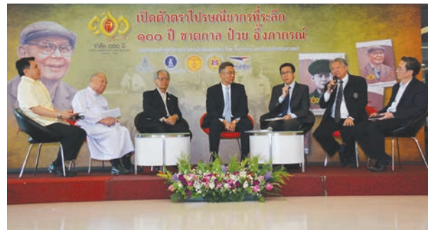
8 -9 100ปี ชาตกาล ป่วย อังการณ ภาคร่วมฉลอง เปิดตัวตราไปรษณียากรที่ระลึก ชุด อ.ป่วย