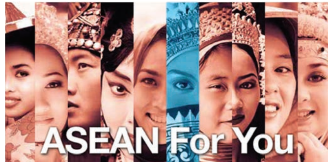
10 -17 Top Five Tour ASEAN