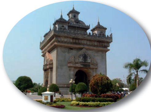
ประตูชัย เมืองเวียงจันทน์

ประเทศอาเซียนได้มีมติเห็นชอบที่จะให้ความสำคัญในเรื่องการส่งเสริมการเดินทางท่องเที่ยวภายในภูมิภาค (Intra – ASEAN Travel and Tourism) เพื่อเป็นการกระตุ้นทางเศรษฐกิจของประเทศในภูมิภาคดังนั้นกลุ่มสังคมศึกษา ศาสนาและวัฒนธรรมจึงขอแนะนำเสนอ Top Five Tour ASEAN ซึ่งเป็นสถานที่สำคัญของแต่ละประเทศในกลุ่มอาเซียน ในฉบับนี้จะขอแนะนำเสนอประเทศเพื่อนบ้านใกล้เคียงก่อนคือ ลาวกับพม่า