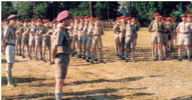
24 - 25 ลูกเสือกองร้อยพิเศษในความทรงจำ

กิจกรรมแนะนำอาชีพ โดยผู้ปกครองให้นักเรียน