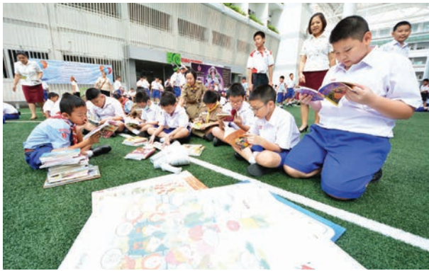
6 - 7 อัสสัมชัญแผนกประถม จัดกิจกรรม “60 เล่ม เอเชีย อ่านถวายเจ้าฟ้าฯ นักอ่าน”