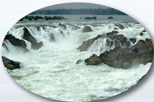
น้ำตกคอนพะเพ็ง

มหานทีแห่งแม่น้ำโขง แอ่งกร่าแห่งเอเชียอยู่ห่างจากเมืองปากเซไปประมาณ 150 กม.