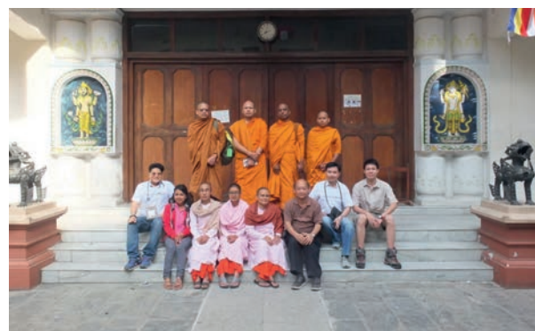
22 - 23 แพทย์อาสา ช่วยเหลือชาวเนปาล