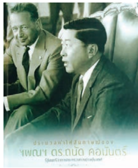
18 - 19 ถนัด คอมันตร์ กับอาเซียน