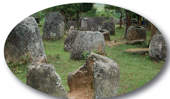
มรดกโลก หุ่นไหหิน เมืองเชียงขวาง

เป็นแหล่งท่องเที่ยวที่สำคัญของเมืองเชียงขวางความมหัศจรรย์ของภาชนะมีรูปทรงคล้ายไหทำด้วยหินทราย