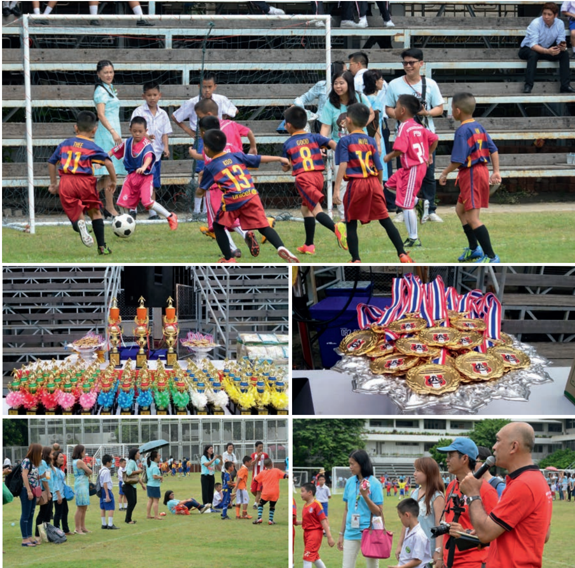
เรียบเรียงโดย ม.ชาญสิทธิ์ วงศ์เสงี่ยม