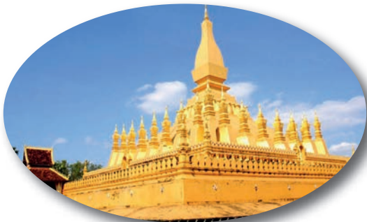
พระธาตุหลวง เมืองเวียงจันทน์

เป็นอนุสรณ์สถานที่ยิ่งใหญ่ สร้างขึ้นเพื่อระลึกถึงผู้ที่เสียสละในการปฏิวัติพรรคคอมมิวนิสต์