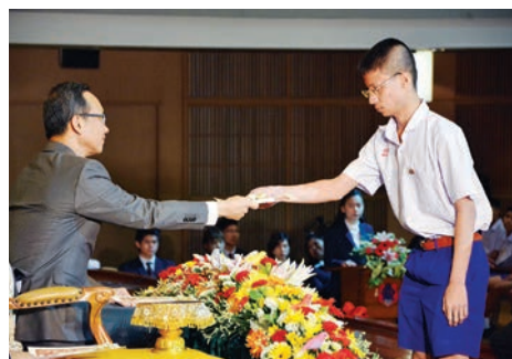
พิธีมอบเกียรติบัตร นักเรียนดีเด่นด้านวิชาการ ประจำปีการศึกษา 2558