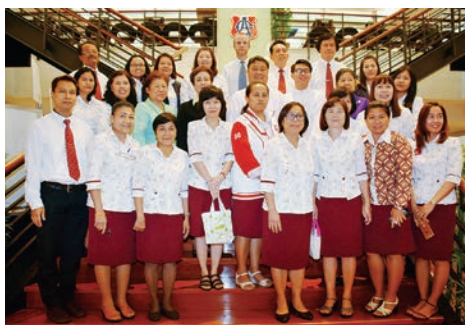
โรงเรียนอัสสัมชัญ ได้รับการรับรอง โรงเรียนเอกชนประเภทสามัญศึกษา ที่มีคุณภาพสู่มาตรฐานสากล ในระดับดีมาก