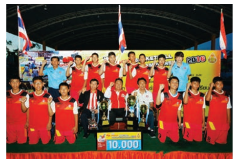
อัสสัมชัญ 13 ปี ทีม เอ คว้าแชมป์บาสเกตบอล สพฐ.-สปอนเซอร์ ไทยแลนด์ แชมป์เปียนชิพ 2016 รอบชิงแชมป์ประเทศไทย 4 สมัยติด