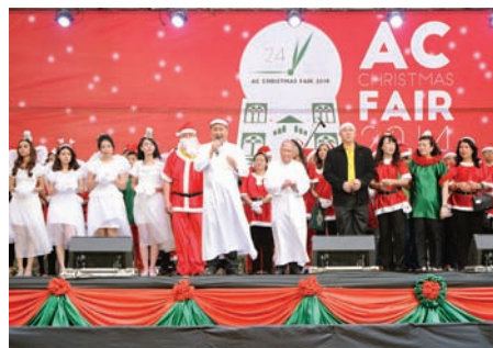
เอชคริสมาสแฟร์ 2014