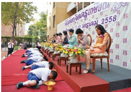
พิธีบุญกฐินศรัทธา