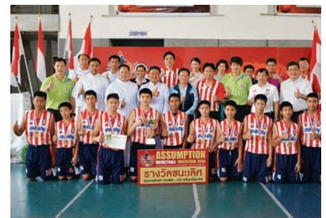
แชมป์บาสเกตบอล อัสสัมชัญ 2014