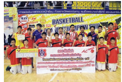
ทีมบาสเกตบอลอัสสัมชัญ รุ่น 13 ปี คว้าแชมป์ถ้วยพระราชทาน 2 สมัย บาสเกตบอลสปรอนเซอร์ ไทยแลนด์ แชมป์เปียนชิพ 2014