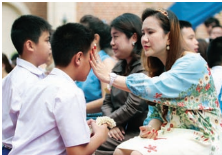
งานวันแม่พระอัสสัมชัญ พิธีถวายพระพร สมเด็จพระนางเจ้าพระบรมราชินีนาถ และกิจกรรมรำลึกพระคุณแม่