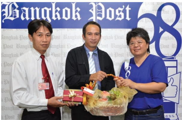
มอบกระเช้าแสดงความยินดีครบรอบ 68 ปี หนังสือพิมพ์บางกอกโพสต์

นอกจากนี้คณะกรรมการนักเรียนในนามกรรมการนักเรียนจตุรมิตรสามัคคี ประกอบด้วย สภานักเรียนโรงเรียนอัสสัมชัญ คณะกรรมการนักเรียนโรงเรียนสวนกุหลาบวิทยาลัย คณะกรรมการนักเรียนโรงเรียนเทพศิรินทร์ ร่วมแสดงความยินดีกับคณะกรรมการนักเรียนโรงเรียนกรุงเทพคริสเตียนวิทยาลัย ในโอกาสครบรอบ 162 ปี แห่งการก่อตั้งโรงเรียนกรุงเทพคริสเตียนวิทยาลัย