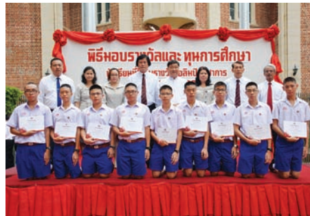
พิธีมอบรางวัล และทุนการศึกษา สำหรับนักเรียนที่ได้รับรางวัลโอลิมปิกวิชาการ การทดสอบ O-Net และการทดสอบ FSG.