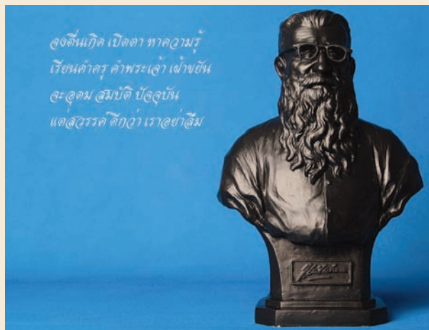
“บราเดอร์อีแลร์ ครูฝรั่งแห่งสยามประเทศ” ทางสถานี โทรทัศน์ไทยพีบีเอส กับ สารคดี คน... แรงบันดาลใจ

รายได้หลังหักค่าใช้จ่าย ร่วมสร้างภาพยนตร์สารคดี