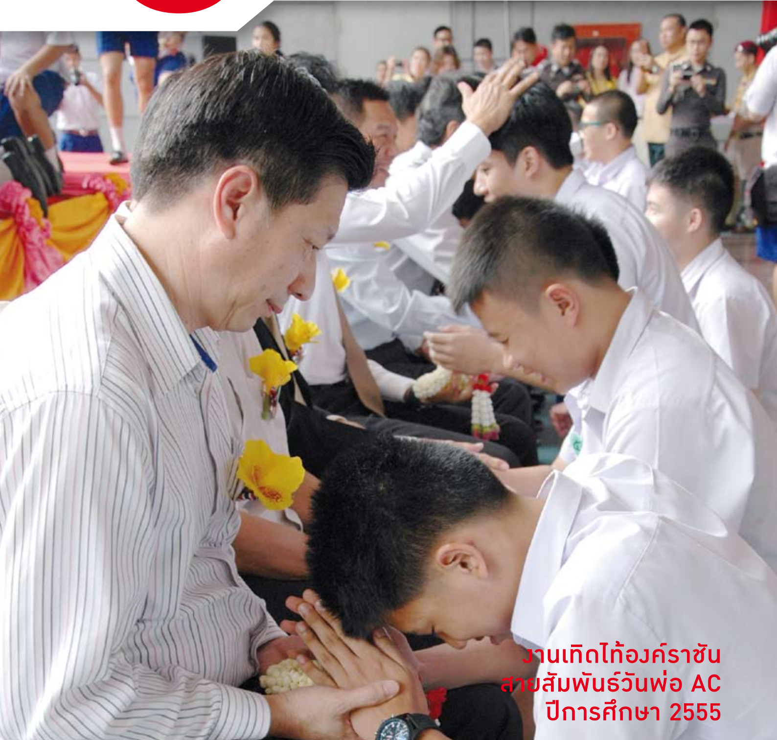
งานเทิดไถ่องค์ราชัน สายสัมพันธ์วันพ่อ AC ปีการศึกษา 2555