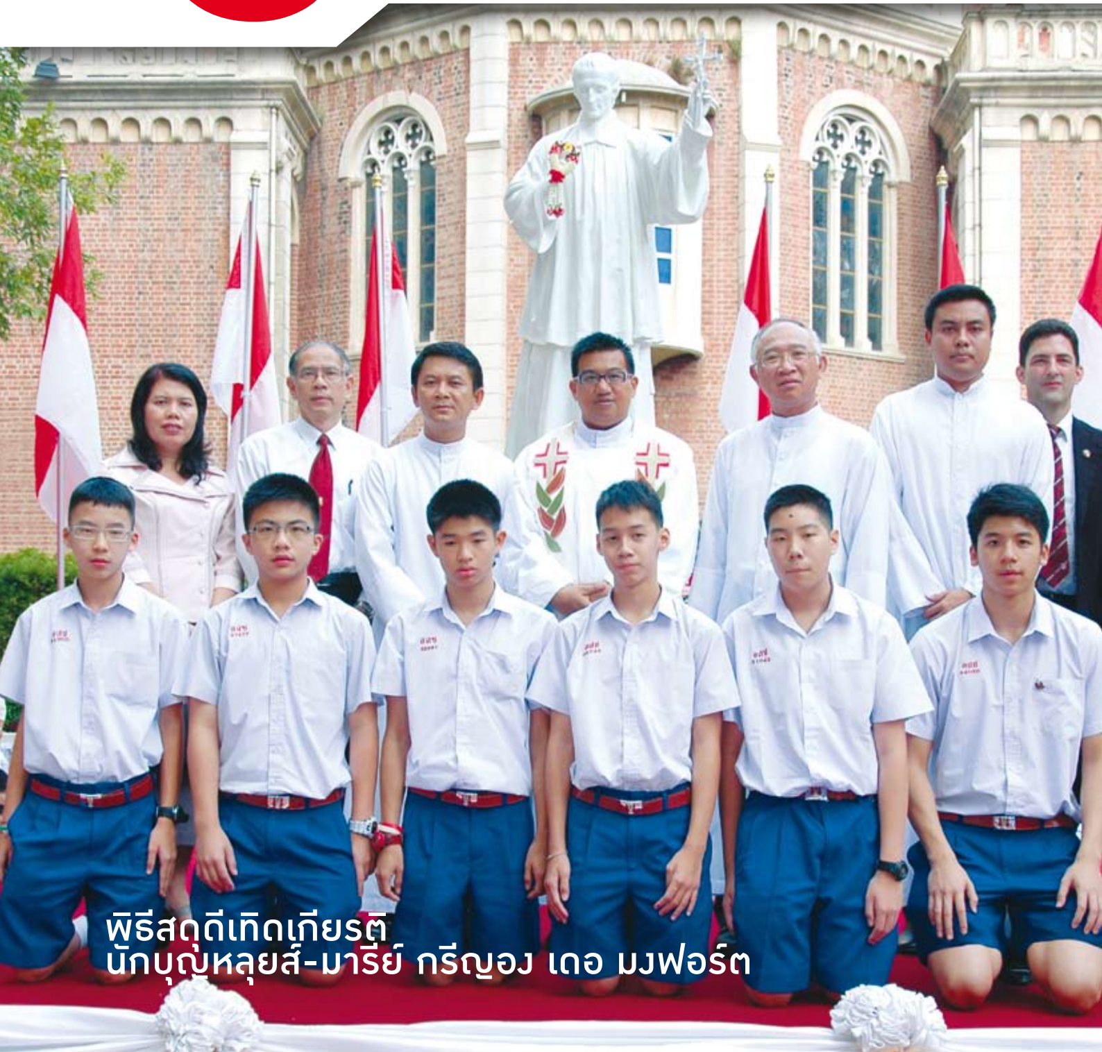
พิธีสวดดีเท็ดเกียรต์ นักบุญหลุยส์-มารีย์ กรีนวูด เดอ มงฟอร์ต